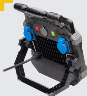
2 spatwaterdichte contactdozen