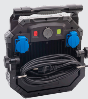
Mogelijkheid voor opwikkelen kabel