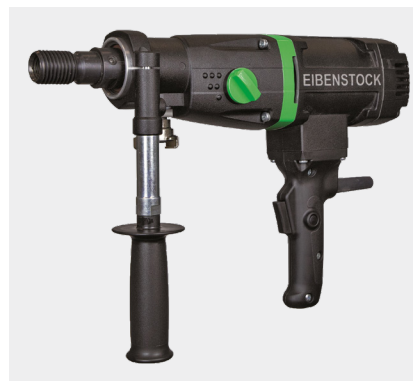
Diamantboormachine PLD 182.1 NT Artikelnr. 10.094.82