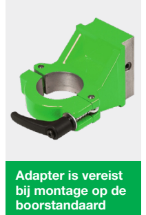
Adapter is vereist bij montage op de boorstandaard Artikelnr. 10.091.55