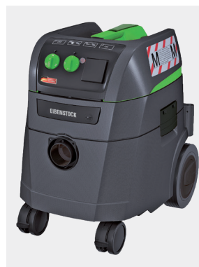
Industriestofzuiger DSS 35M iP Artikelnr. 12.924.00

Machine, boorstandaard en adapter zijn als set verkrijgbaar onder art. nr. 10.094.74