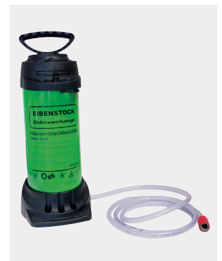
Waterdruktank 10L Artikelnr. 12.900