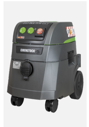
Industriestofzuiger DSS 35M iP Artikelnr. 12.924.00