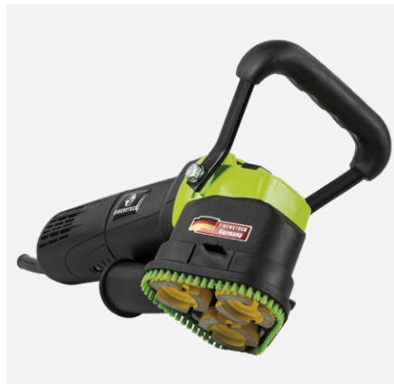
Betonslijper driehoek EES 1400-3 Artikelnr. 10.097.76