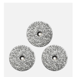
Hardmetaalschijf set voor verf en hout 3 x Ø 44 mm Artikelnr. 12.328.03