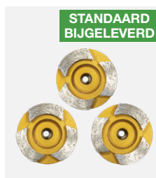
Diamantschijf set voor beton 3 x Ø 44 mm Artikelnr. 12.328.01